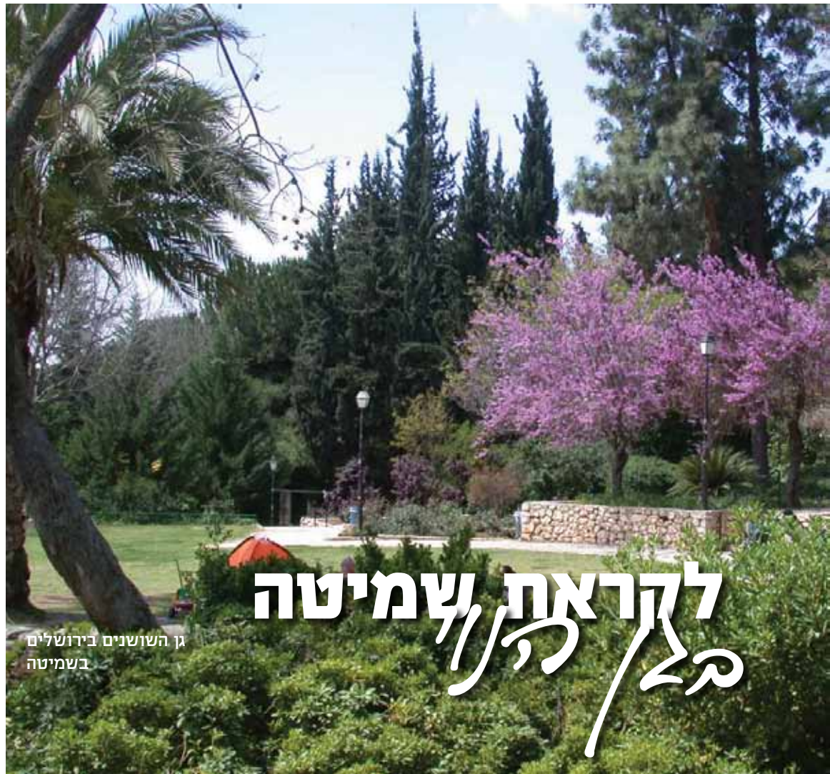
גן השושנים בירושלים בשמיטה