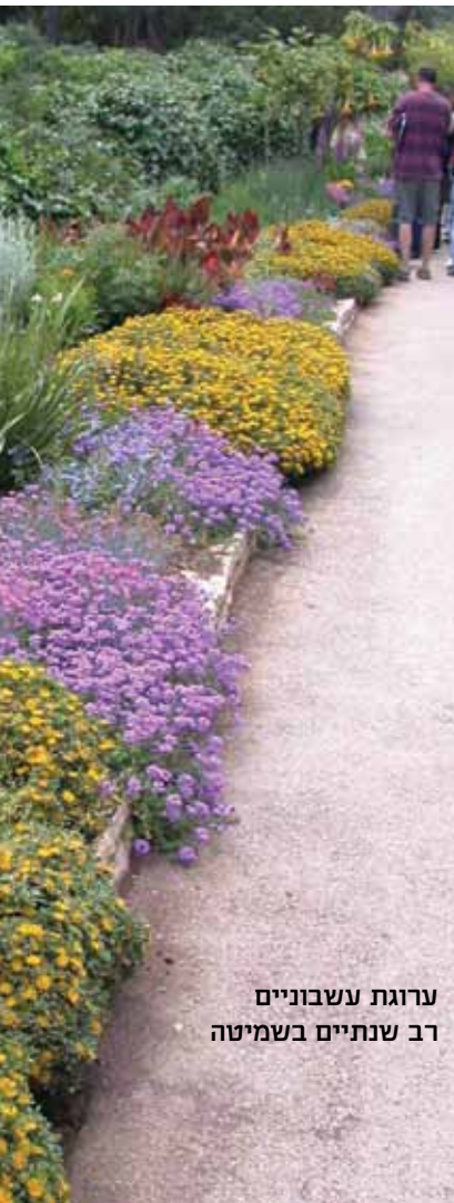
ערוגת עשבוניים רב שנתיים בשמיטה